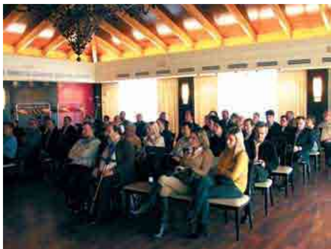
Vista general del público asistente a la Junta General Ordinaria de ENA