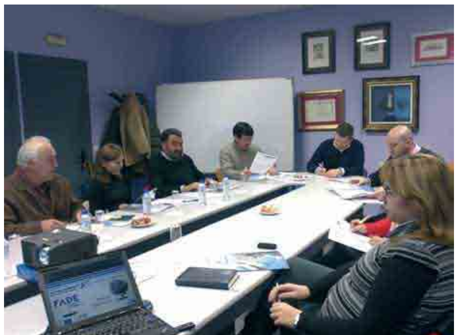
Asistentes a la jornada sobre Facturación Electrónica celebrada en el Centro Sat de La Felguera

Por tanto, una factura en formato electrónico (pdf, doc, jpg, xls...) y mandada