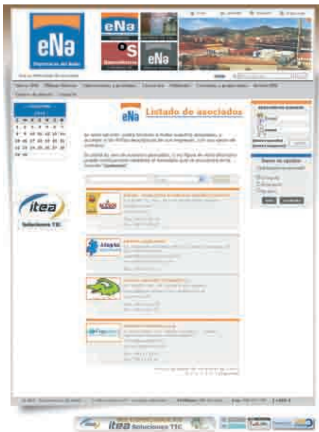
Listado de empresas asociadas