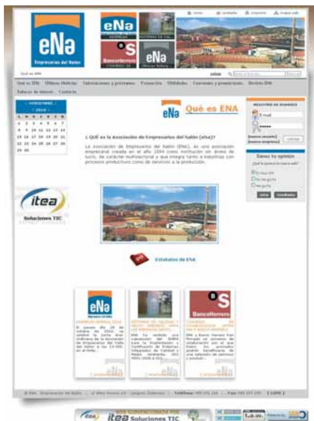
Página de inicio de la Web corporativa de ENA.

Mejor funcionalidad, nuevo diseño y más información, características principales del nuevo portal de ENA