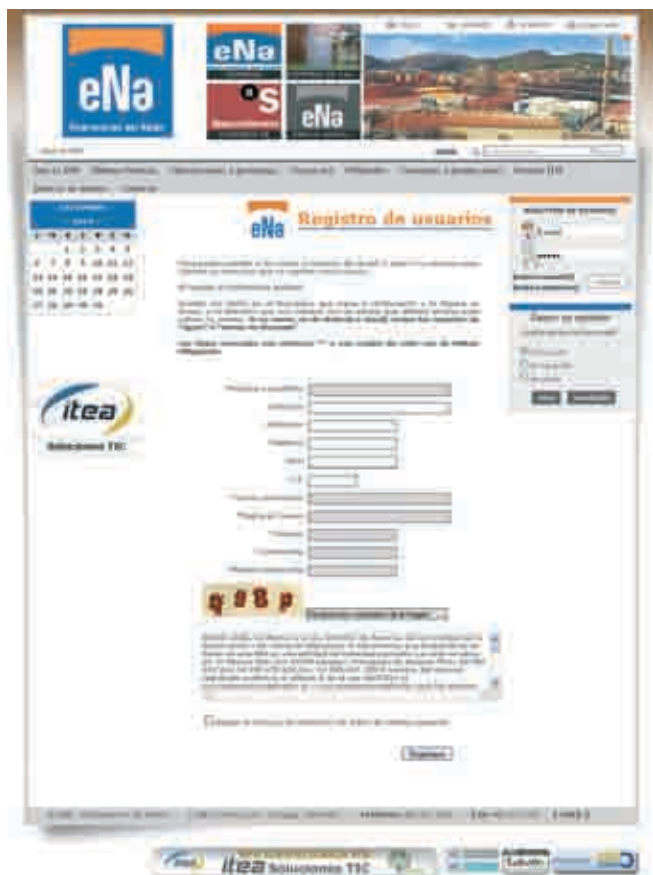
Registro de Usuarios

El registro de usuarios permite elaborar una completa base de datos de todos y cada uno de los miembros de la Asociación;