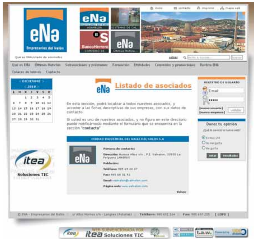
Ficha de empresa asociada

El gestor prácticamente no tiene límites, permite documentar los contenidos con textos, fotos, elementos multimedia, inserción directa de videos de youtube, tablas, enlazar todo tipo de archivos para que el visitante pueda descargarlos, insertar enlaces a terceros, inserción de galería de fotos etc.